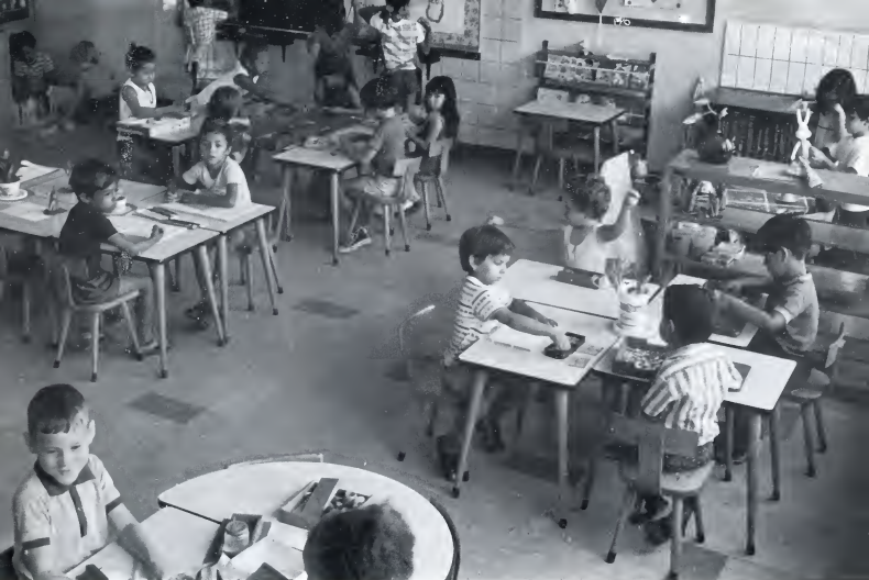
Tur mucha mester hanja un igual oportunitad pa bishita kleuterschool.

E raport ku e tres ekspertonan di UNESCO a bin traha pa nos aki (un ratu) no ta konte nada mucho kos nobo.